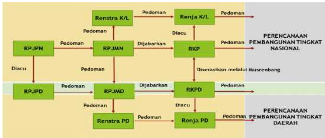
Gambar 1.1. Keterkaitan Antar Dokumen Perencanaan